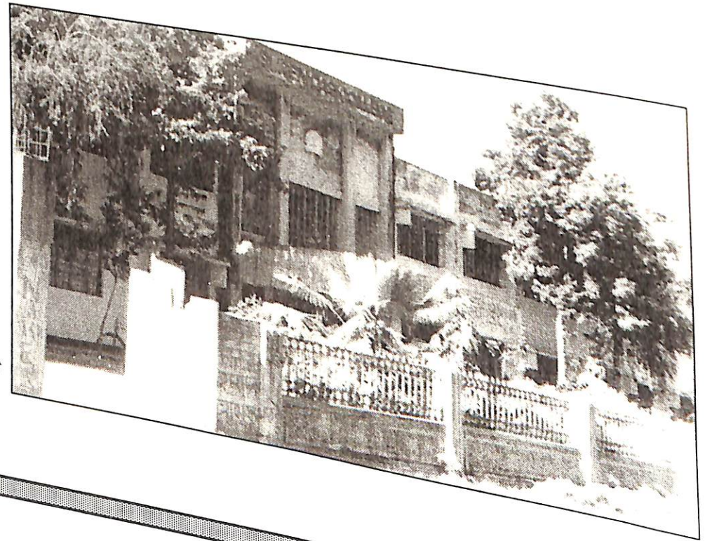
সুৰেণ দাস মহাবিদ্যালয়, হাজো